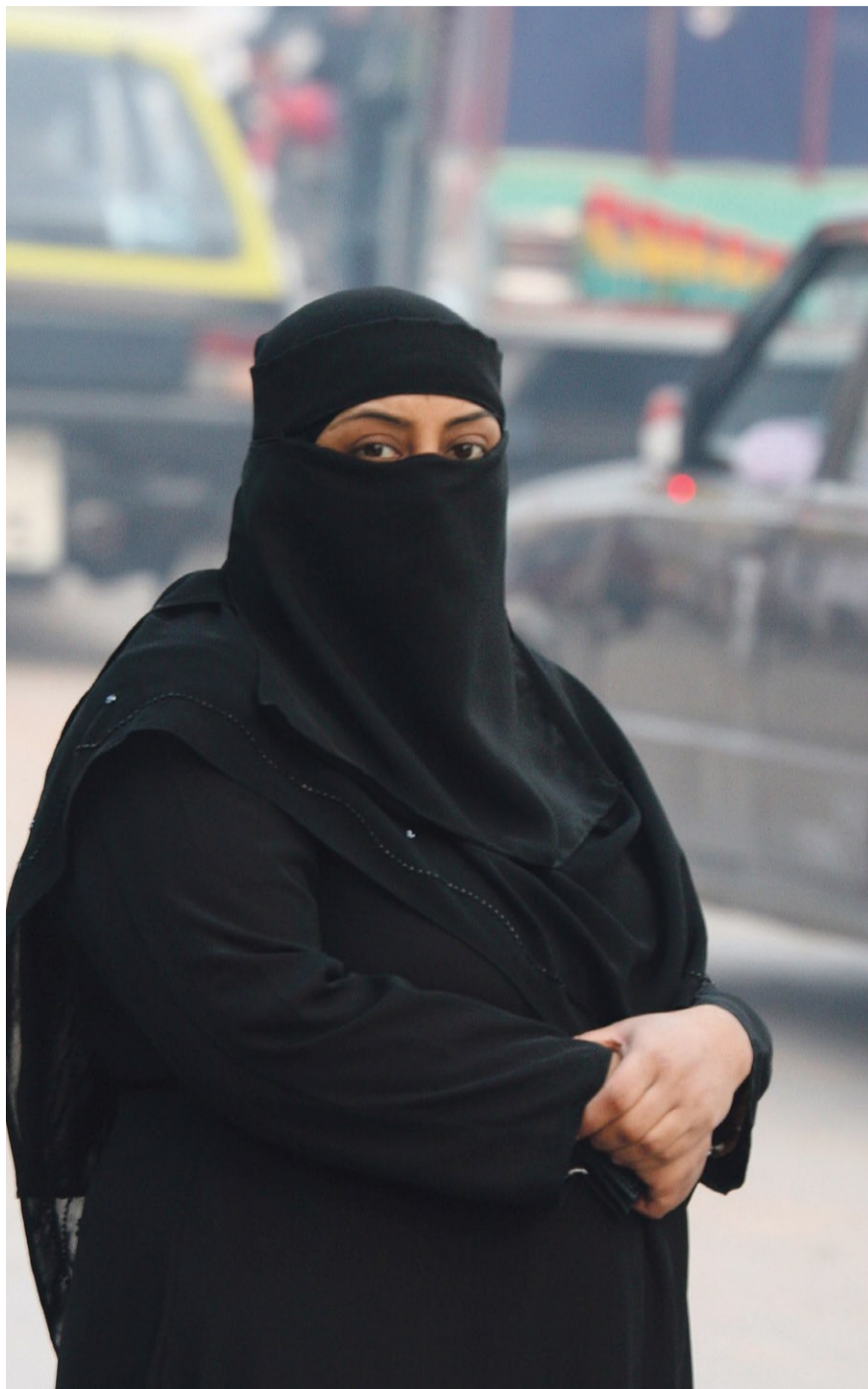
Weckt Unbehagen: Frau mit Kopftuch und Gesichtsschleier.

Das Unbehagen, das der Anblick einer Frau im Kopftuch hierzulande auslöst, reicht bis weit ins rechte politische Lager hinein. So weit, dass konservative Männer, die sich nicht nur seinerzeit gegen das Frauenstimmrecht, sondern auch gegen jede Revision des Ehe- und des Scheidungsrechts gestemmt und den Gleichstellungsartikel ebenso wie die Mutterschaftsversicherung abgelehnt haben, dieses Unbehagen öffentlich bekunden.